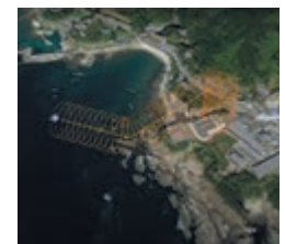
3Dマップと物流ドローン航路

同コンソーシアムでは、今年度も引き続きすさみ町の課題解決と住民に寄り添ったスマートシティに向けた取り組みを実施して参ります。