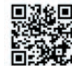
観光と防災ポータルサイト