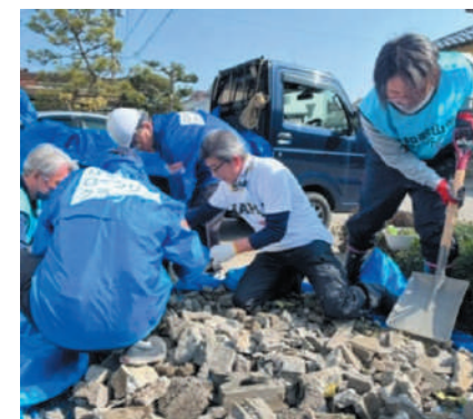
砕いたブロック塀を運搬

3月末までにお寄せいただいた義援金は、前回と合わせ368,407円となりました。集められた義援金は、中央共同募金会を通じ被災者に分配されます。町内各場所に募金箱を設置していますので引き続きご協力をよろしくお願いいたします。