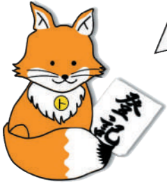
不動産登記推進イメージキャラクター「トウキツネ」