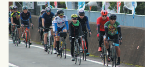
ふるさと納税を活用したGOAT・サイクリングイベントのライドオンスサミ