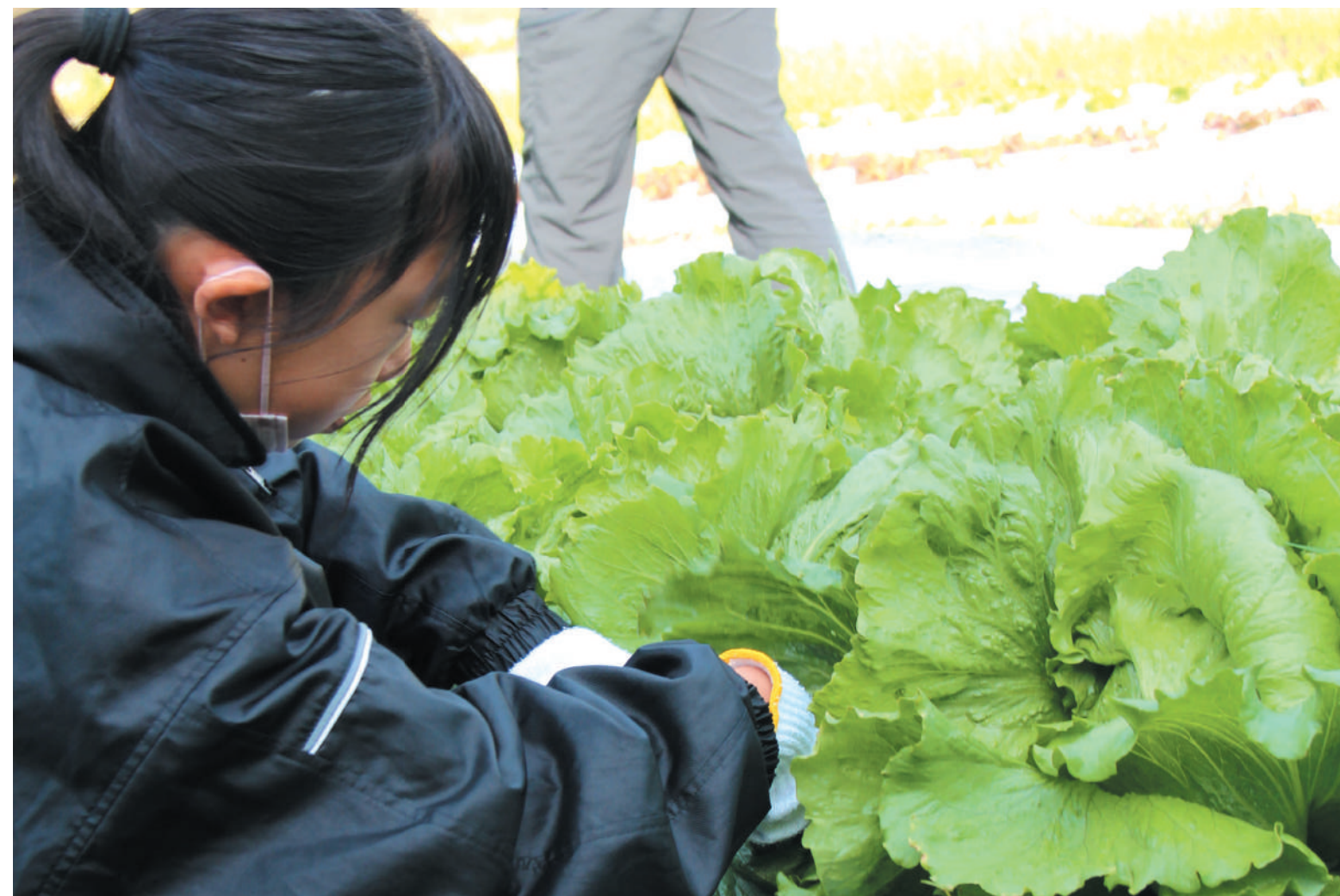
↑最初から自分たちで育てた大きなレタスを収穫。刈り取る瞬間が気持ちいい！

レタス栽培発祥の地と言われるすさみ町で生まれ育った中学1年生が、レタスの種まきから収穫、さらに自分たちで商品化する体験学習を行いました。