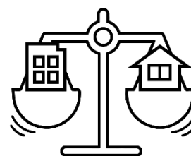
Work Life Balance

このような状況のもと、職員のワークライフバランスに配慮した職場環境づくりを推進する中、人件費の抑制を図りながら安定的な行政サービスの提供を行うことを目的に、新たな定員適正化計画を策定します。